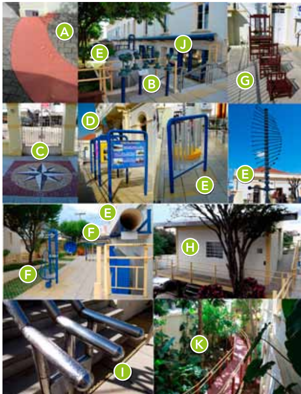
Figura 3 – Mosaico de imagens dos elementos expositivos do Jardim da Percepção.

pesquisas – das quais decorrem intervenções didáticas – que, ao contrário desses trabalhos, enfocaram as contribuições de elementos expositivos do Jardim da Percepção para a aprendizagem de conceitos científicos em um espaço de educação não formal.