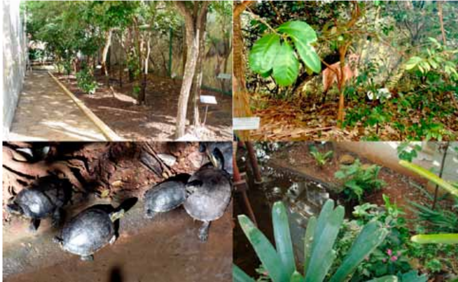
Figura 5 – Mosaico de imagens dos ambientes de imersão: Cerrado (imagens superiores) e Mata de Galeria (imagens inferiores).

Além dos vegetais, alguns vertebrados foram incorporados aos ambientes. No Cerrado há apenas um casal de jabutis-piranga. Na Mata de Galeria há 12 espécies: alguns indivíduos de uma espécie de cágado, mais 11 espécies de peixes, identificadas em uma placa à beira do lago.