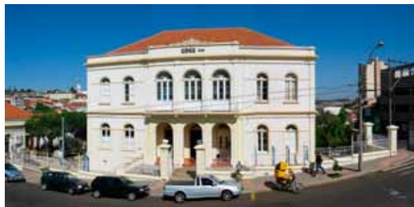
Figura 1 – Fachada do CDCC.

A Coordenadoria de Divulgação Científica e Cultural, criada em 1980, como um setor responsável por estreitar as relações entre docentes da USP e professores dos atuais ensinos fundamental e médio [13; 26], foi nomeada Centro de Divulgação Científica e Cultural (CDCC) em 1995 e ocupa um prédio histórico no centro do município de São Carlos (Figura 1).